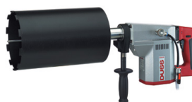
Diamantboormachines voor nat- en droog boren