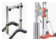
Boorstandaards - Accessoires