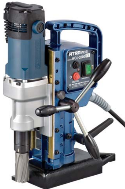
WOJ-3200 ACTIEPRIJS € 995,=