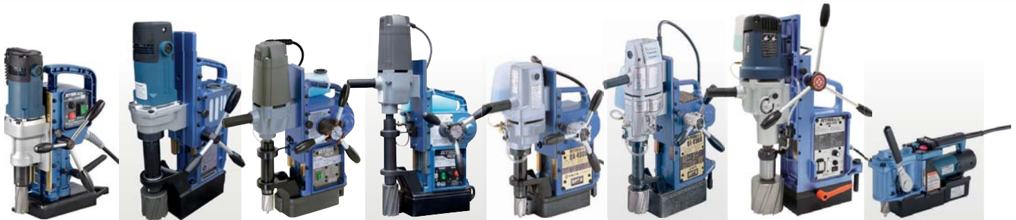
WOJ-3200 € 995,=