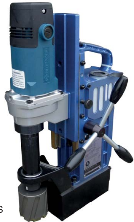
AO-5575A ACTIEPRIJS € 1.565,=