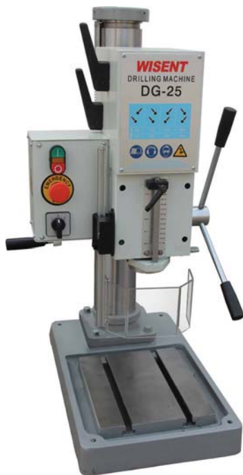
DG25 € 1.995,=

Boorhouders en boorgereedschap op aanvraag leverbaar.