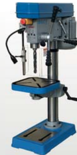
D1612 € 830,=

Betrouwbaar, stevig, extra sterke kolom en onderhoudsarm. Professionele kwaliteit boormachines. Voor algemeen voorkomend boorwerk. Alle WISENT boormachines worden geleverd met boorbeschermer met microscharnelaar en voldoen aan de CE machinerichtlijnen. Tafelboormachines ook in 230V leverbaar. Boorhouders en boorgereedschap op aanvraag leverbaar.