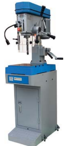
D2510 € 950,=