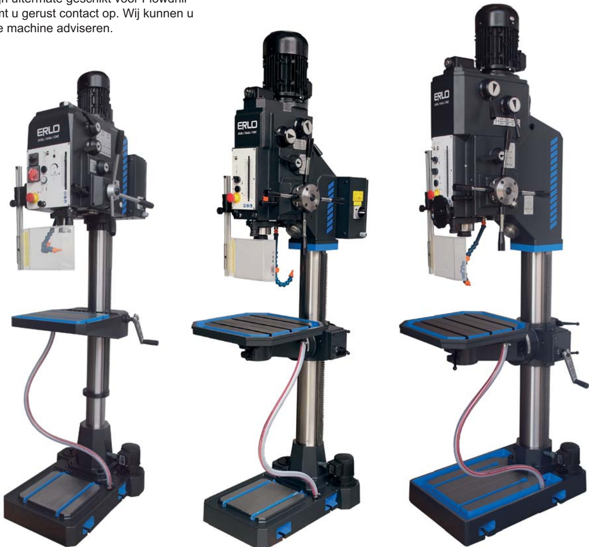
TSAR25 € 6.525,=

Setprijs i.c.m. € 432,= Flowdrill M8 short (standaard)