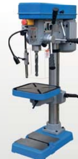
D23VT € 1.975,=