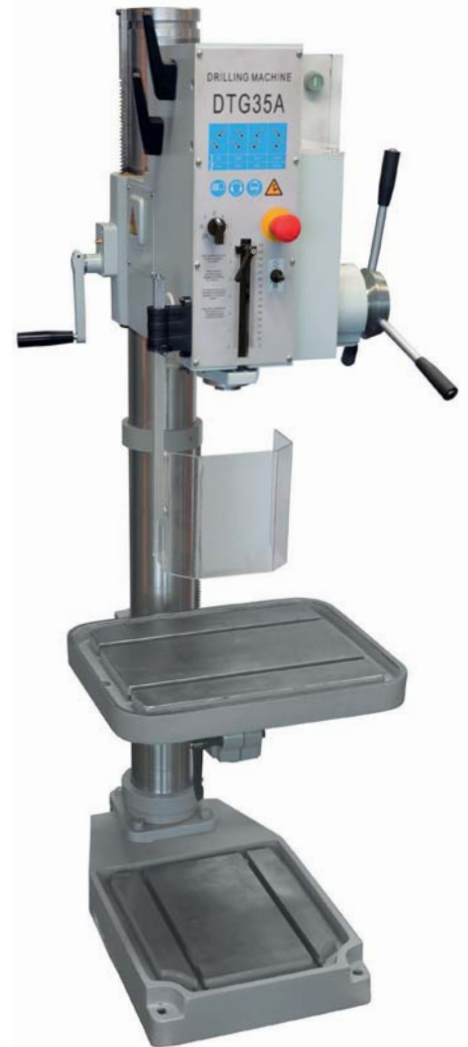
DTG35A € 3.970,=