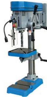
D2312 € 880,=