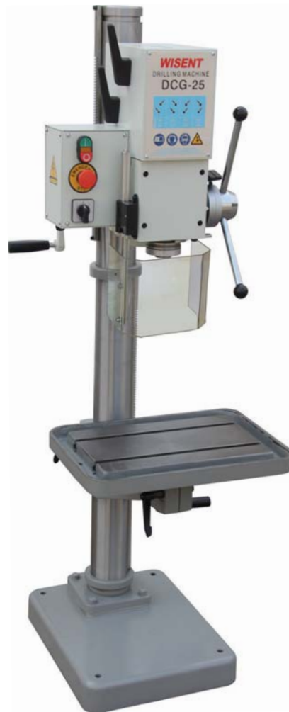
DCG25 € 2.175,=